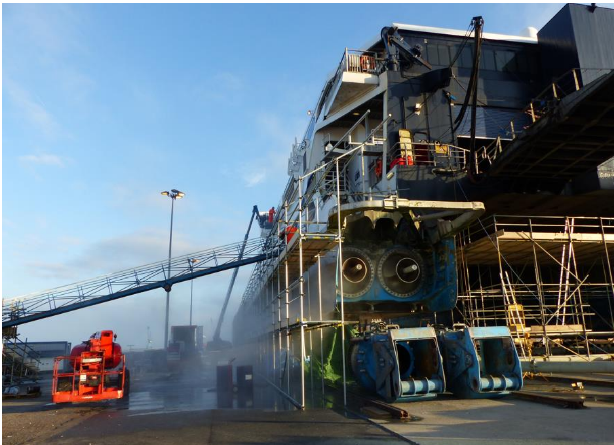
Port de Cherbourg – Plateau nautique

Ports de Normandie va également procéder au confortement de la forme de Radoub : mise aux normes environnementales, changement des systèmes de pompage et électriques de la forme et étude sur la réhabilitation des organes structurels de la forme. Budget : 220 k€.