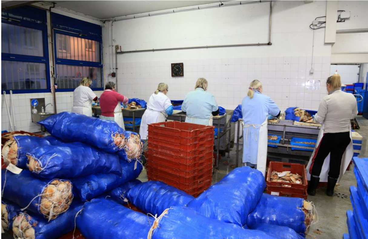
Crée du Port de Dieppe

Les halles à la marée de Dieppe et Cherbourg sont vieillissantes. Ports de Normandie va donc menée une étude en vue de leur reconfiguration. L'objectif est de les moderniser et de mieux les intégrer au tissu urbain qui les environne, tout en tenant compte de la réalité induite par les conséquences du Brexit.