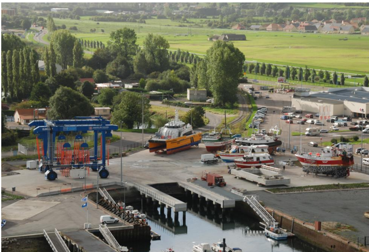
Port de Dieppe – Plateau nautique