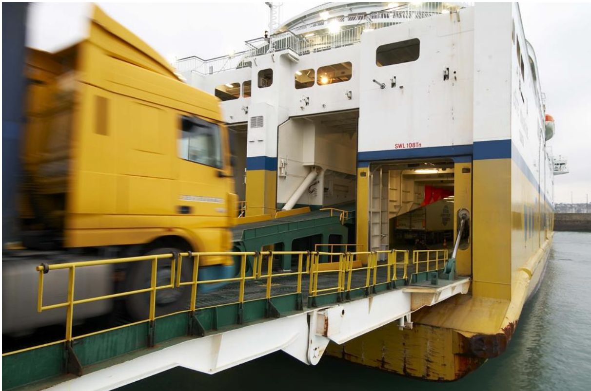
Transmanche - Dieppe