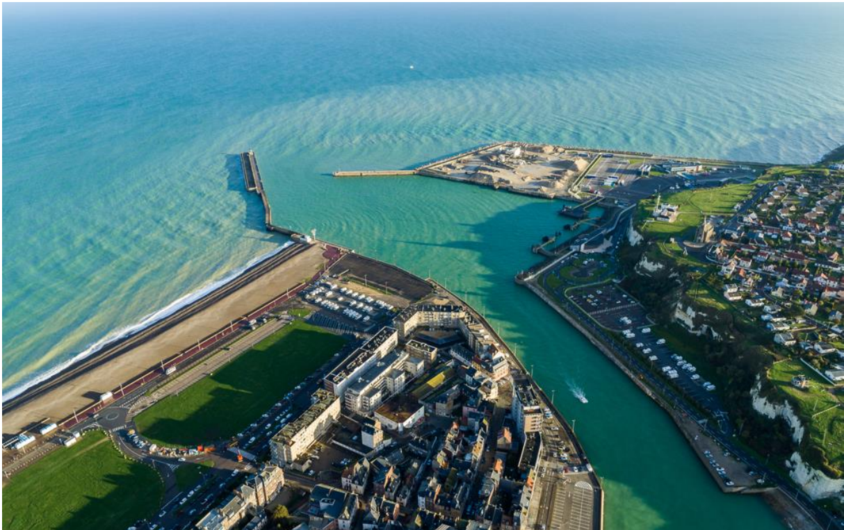
Avant-Port de Dieppe

6,6 M€ sont consacrés à ce projet, dont 125 K€ pour la Maîtrise d'œuvre, 125 K€ pour les études de programmation (agitation, géotechniques, topographie) et 260 K€ pour les études environnementales.