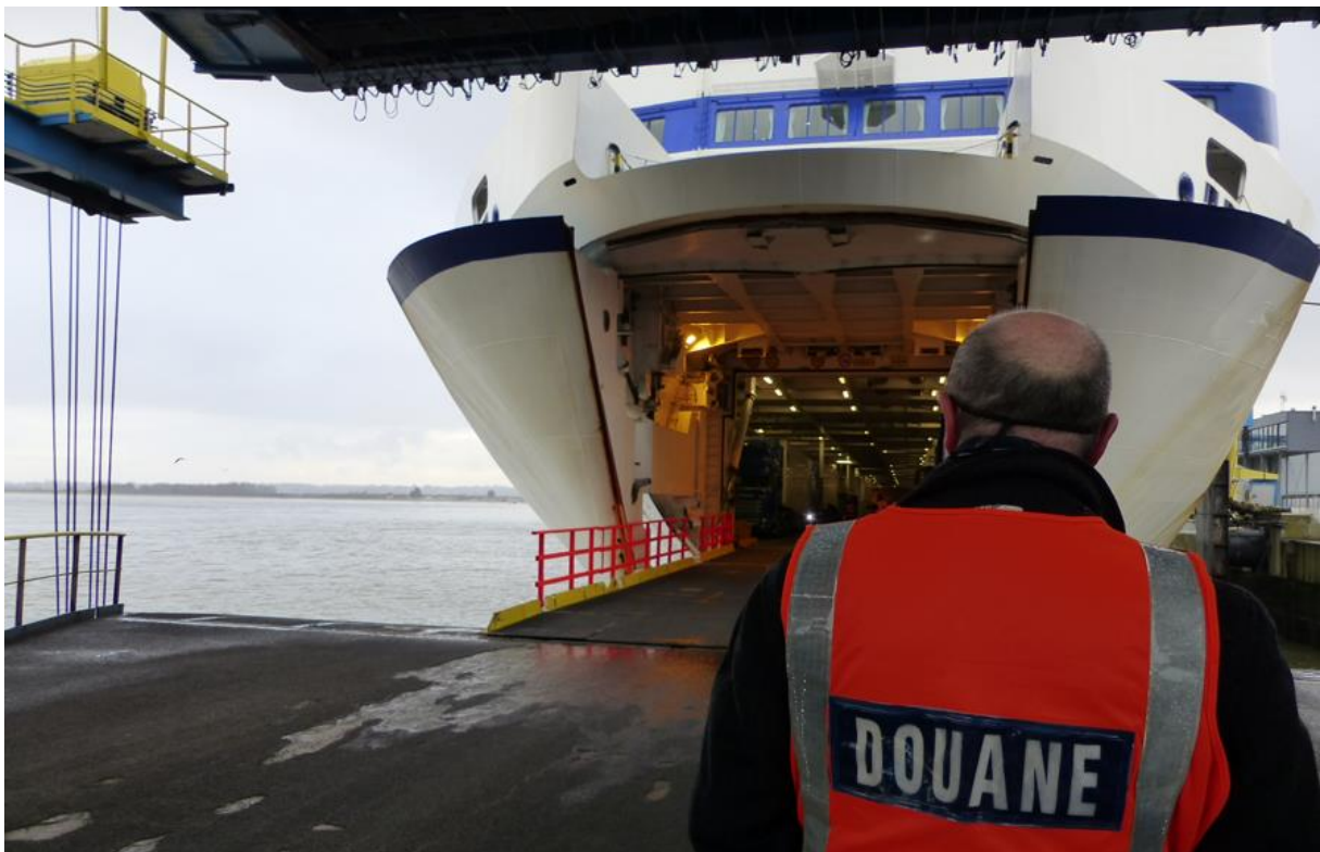
Transmanche - Port de Caen-Ouistreham

Si l'on peut s'attendre à une stabilisation, voire une progression, du marché avec l'Irlande grâce à l'offre mise en place par les compagnies en 2023 (arrivée du Stena Vision à partir de juin 2023, E-flexer Salamanca ou Galicia pour Brittany Ferries et maintien à l'année du WB Yeats sur la route Cherbourg-Dublin pour Irish Ferries), les perspectives sur le Royaume-Uni sont plus incertaines du fait de facteurs économiques propres à ce pays (inflation, parité £/€), et réglementaires (mise en place de la directive EES - Entry Exit System - courant 2023). Cette directive, qui vise à renforcer les contrôles à l'entrée de l'espace Schengen, constitue une source d'inquiétude par l'impact négatif qu'elle pourrait avoir sur la gestion des escales et l'expérience clients.