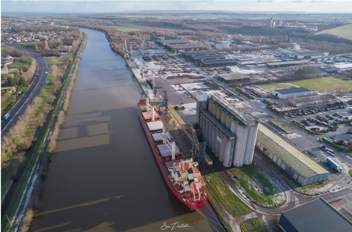
Ports de Caen-Ouistreham – Quai de Blainville – Federal Fraser