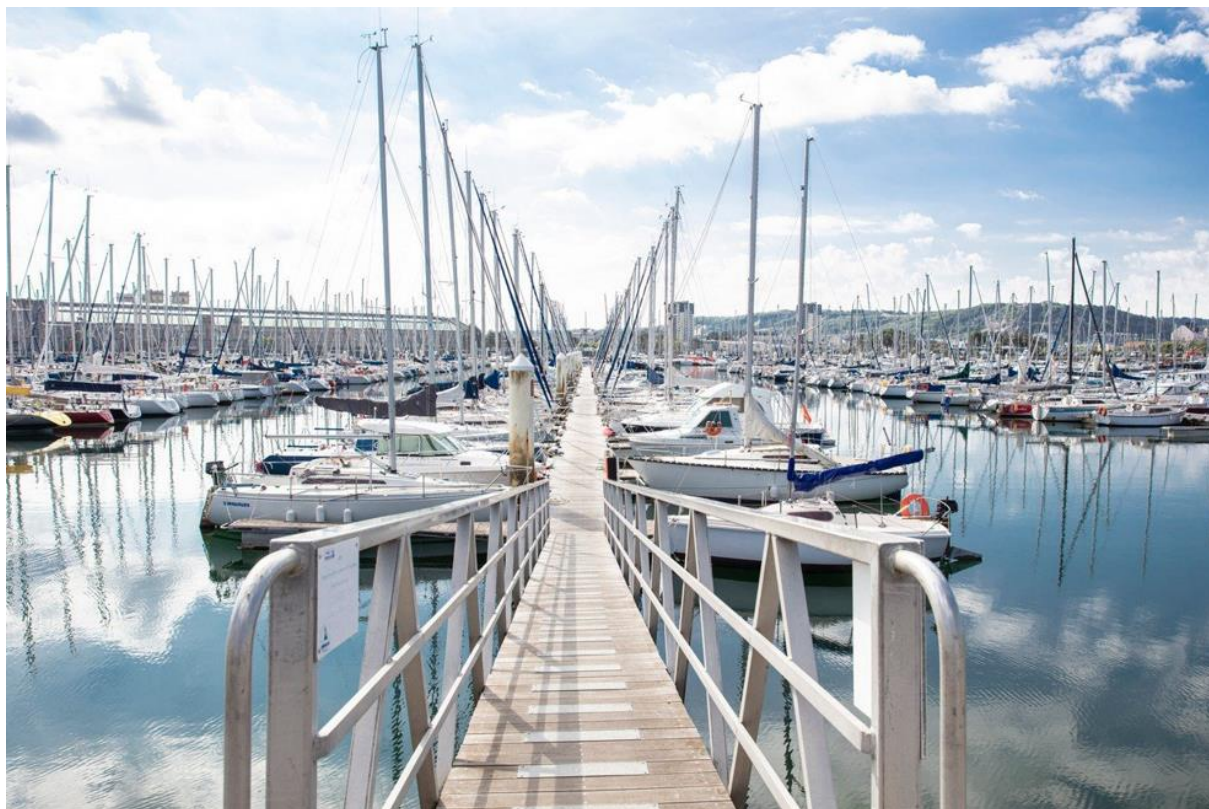
Port Chantereyne – Cherbourg