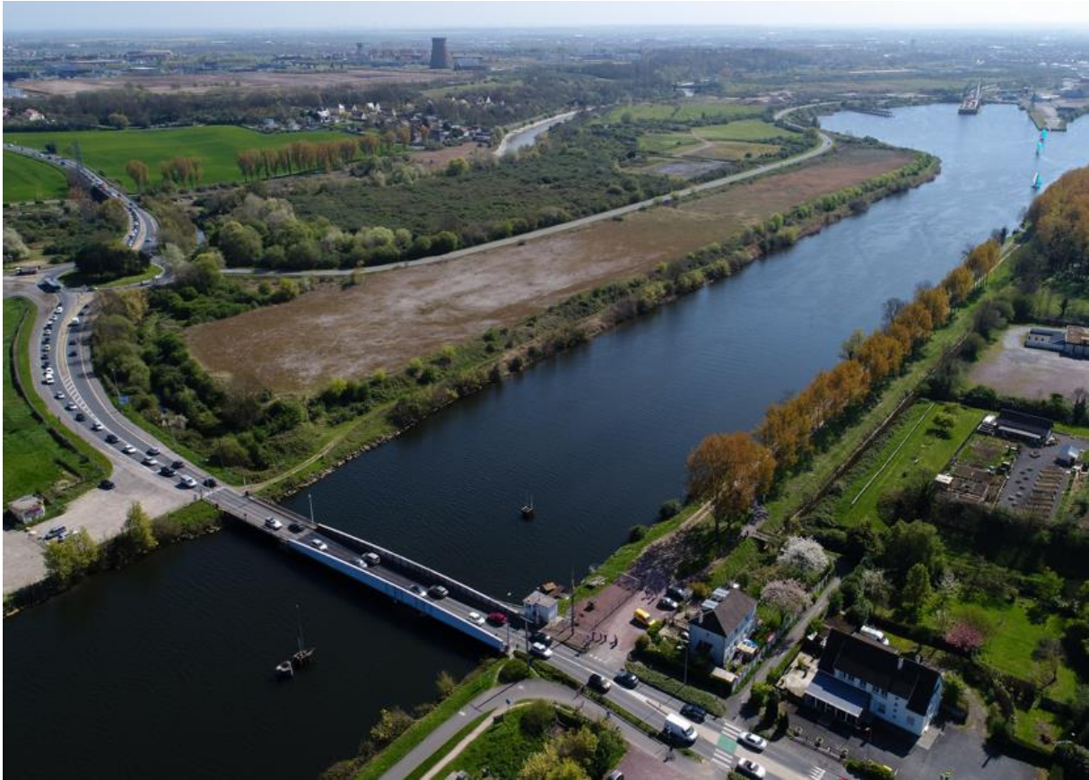
Port de Caen-Ouistreham