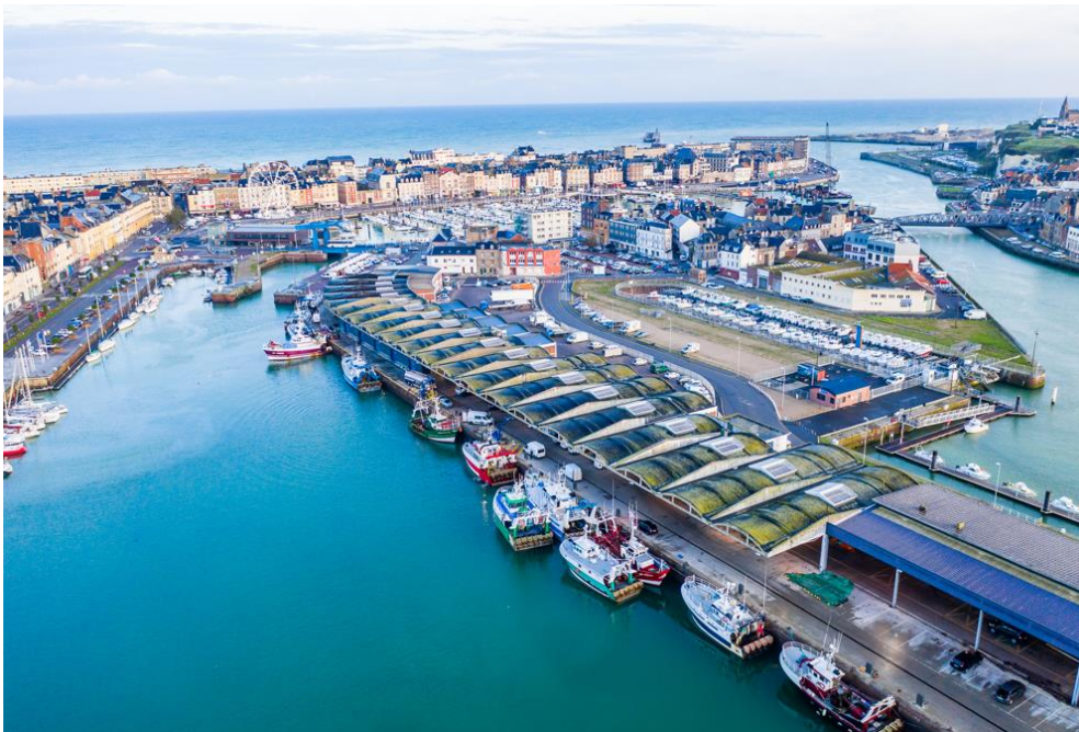
Port de Dieppe – Pêche

Les perspectives d'activités 2023 pour les 3 ports sont donc intimement liées à la qualité du gisement de coquilles Saint-Jacques. Quant à l'apport en poisson à la criée de Dieppe, il constituera un indicateur à suivre. Cherbourg pourrait subir, en 2023, les premières conséquences du Brexit avec le plan de retrait de flotte de navires, notamment hauturiers, proposé par le gouvernement. Les volumes débarqués sont donc susceptibles de sensiblement diminuer.