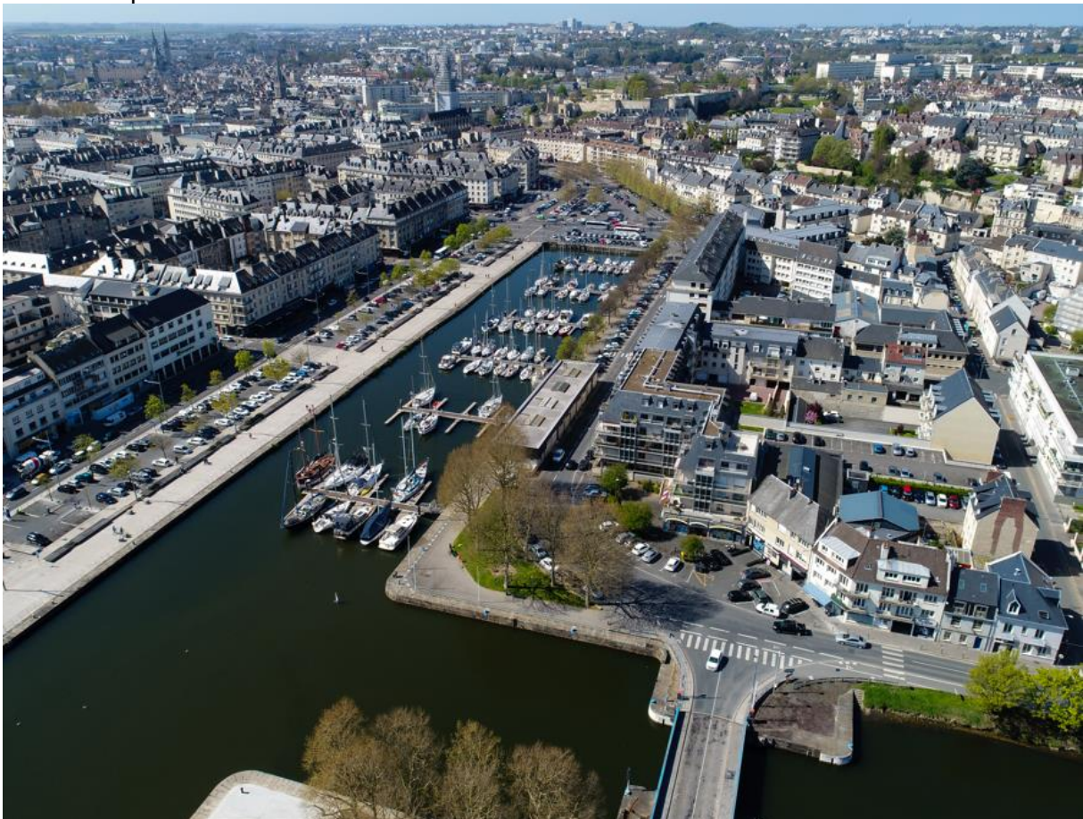
Port de Caen Ouistreham - Bassin St-Pierre