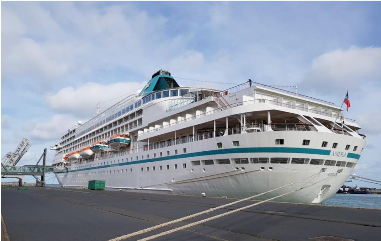
Cherbourg Port - AMERA

2023 s'inscrit dans le Top 3 des dix dernières années avec une cinquantaine d'escales attendues dont une douzaine à Caen et une quarantaine à Cherbourg.