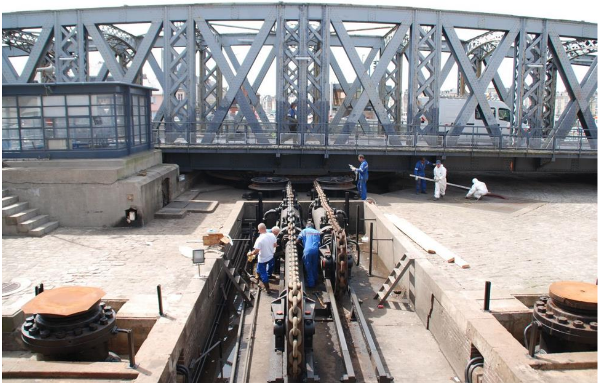
Port de Dieppe – Pont Colbert