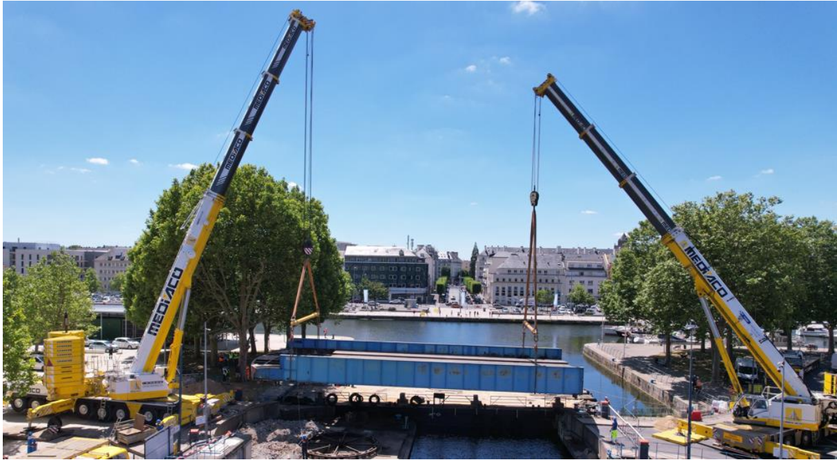
Port de Caen-Ouistreham - Pont de la Fonderie