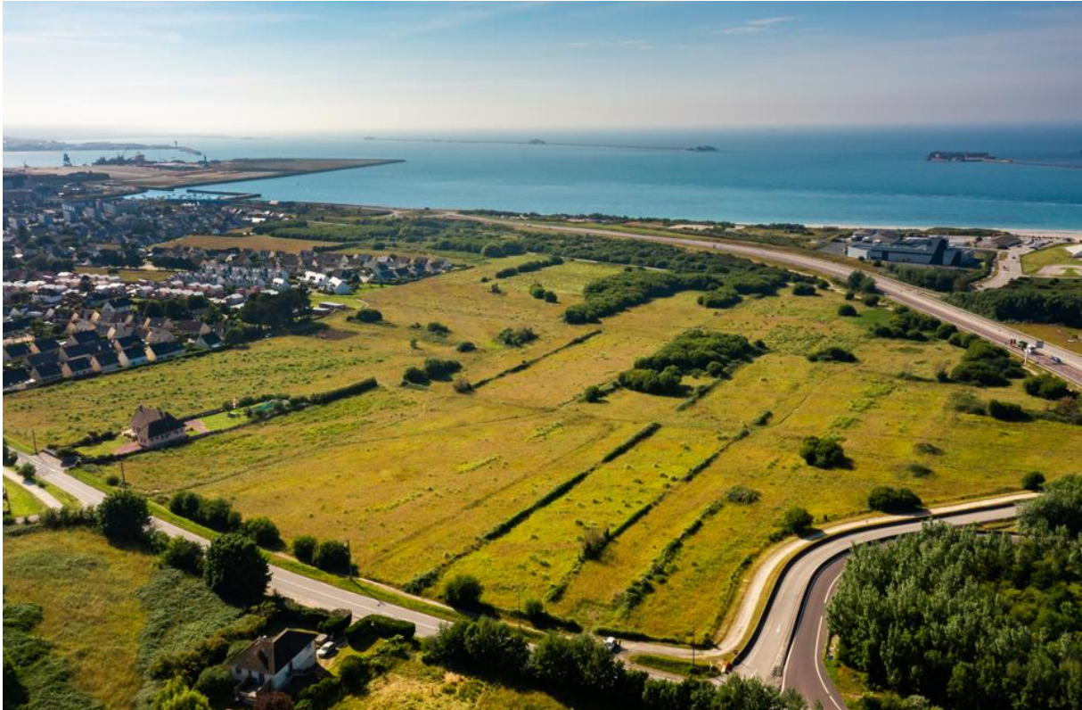
Port de Cherbourg – Croix Morel